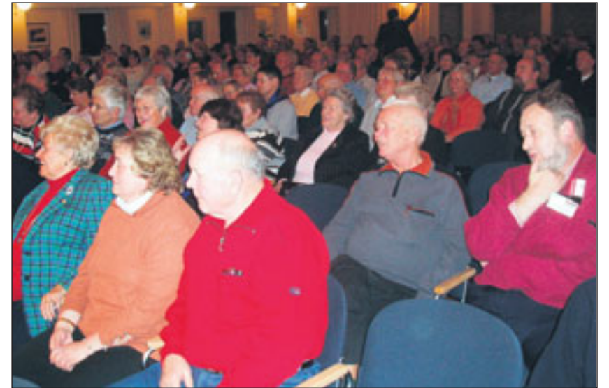
Die Rentenveranstaltung des Landesverbandes Schleswig-Holstein stieß auf reges Interesse, der große Veranstaltungssaal im Rendsburger „Hohen Arsenal“ war voll besetzt.

würden allerdings immer wieder geplündert, um andere Staatsaufgaben, beispielsweise die deutsche Einheit, zu finanzieren. Er schloss seine Ausführungen mit einem Appell an die Politik: „Die Kluft zwischen Bürgern und Politikern ist viel zu groß! Es muss über alle Parteigrenzen hinweg nach einem sozialen Konsens gesucht werden, ansonsten ist die Demokratie in Gefahr.“