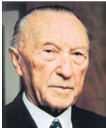
Konrad Adenauer

Das Machtwort des Kanzlers ermöglichte zwar die Verabschiedung des Gesetzentwurfes im Kabinett, aber es beendete die politische Auseinandersetzung um die Rentenreform nicht. Es verlagerte sie lediglich ins Parlament. Nach 43 Sitzungen im Herbst 1956 schloss der Sozialpolitische Ausschuss des Bundestages am 21. Dezember 1956 seine Beratungen ab – nicht ohne vorher in Anhörungen die gegensätzlichen Stellungnahmen der Verbände entgegenzunehmen zu haben. Der Ausschuss zerlegte den Gesetzentwurf der Regierung dabei in zwei Teile für die Arbeiterrentenversicherung und die Angestelltenrentenversicherung.