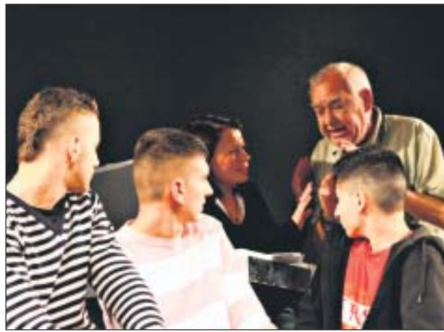
Im Alltag wie auf der Bühne: Interkultureller und generationenübergreifender Austausch fördert Respekt und Verständnis füreinander.

„Allet ganz anders...“: Senioren deutscher und türkischer Herkunft machen in Berlin gemeinsam Theater und haben dabei sichtlich ihren Spaß.